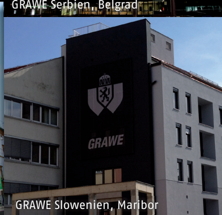
GRAWE Slowenien, Maribor