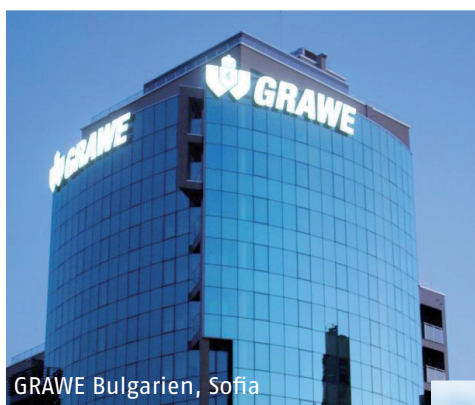
GRAWE Bulgarien, Sofia