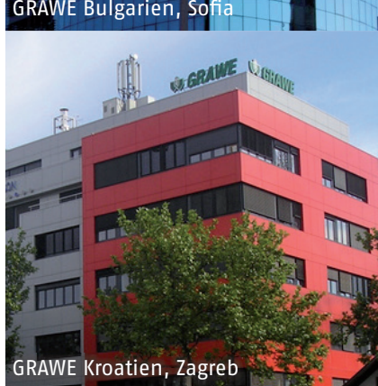
GRAWE Kroatien, Zagreb