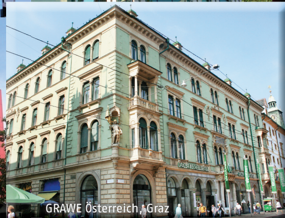
GRAWE Österreich, Graz